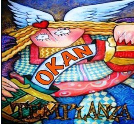
2010 Okan Cuba Templanza