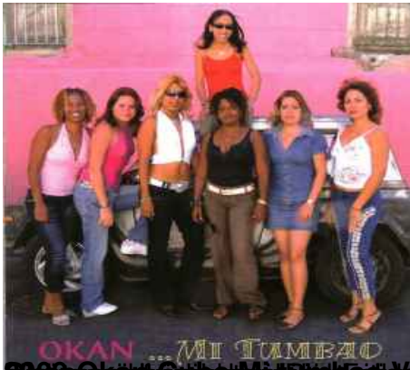
2000 Okan - Mi Tumbao (CD) - Regiõn de la Grijera, Sinaloa, Mexico - Latin Reggae - Undat Ausibigenin